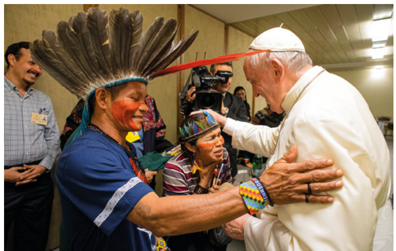
Papst Franziskus segnet Vertreter der indigenen Bevölkerung.

Eine große Herausforderung ist, dass wir als katholische Kirche im Amazonas-Gebiet deutlich weniger Kraft entwickeln als etwa die Pfingstkirchen. Manche reden davon, dass mehr als die Hälfte der Christen, ja sogar bis zu 80 Prozent in dieser Region, inzwischen bei den Pfingst- und Freikirchen sind. Die Pfingstler sind sehr flexibel,